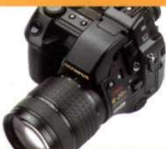
Olympus Camedia E-20R

ВПЕРВЫЕ В УКРАИНЕ! КОНКУРС ЛЮБИТЕЛЬСКИХ ВИДЕОФИЛЬМОВ