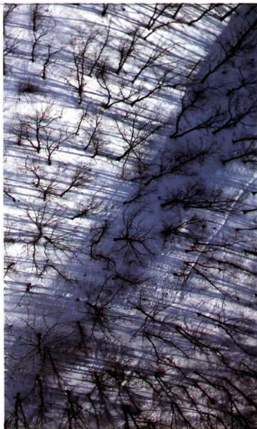
«Зимние» кадры с высоты птичьего полета получаются необычайно поэтичными и выразительными

Некоторые преимущества имеют модели без автофокусировки, поскольку аппараты, позволяющие проводить автоматическое наведение на резкость, как правило, более инерционны, что очень нежелательно для летающих систем.