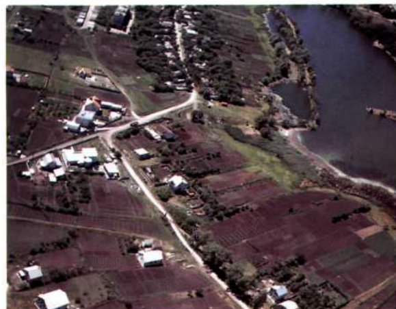
Пример перспективной съемки

Ракеты. Первые опыты по использованию ракет для аэрофотосъемки проводились в германской армии еще в 1900 г. инженером Маулем. Ракета за считанные секунды способна взлететь на высоту в несколько сотен или даже тысяч метров, и оттуда производится съемка. К сожалению, с возвращением на землю дела обстоят хуже. Чем выше поднялась ракета, тем дальше от места старта она приземлится, спускаясь на парашюте. Тут для поиска не обойтись без ра-