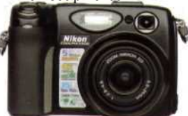
Nikon Coolpix 5400